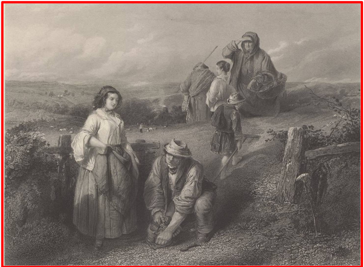
Illustration de La providence des pauvres gens.