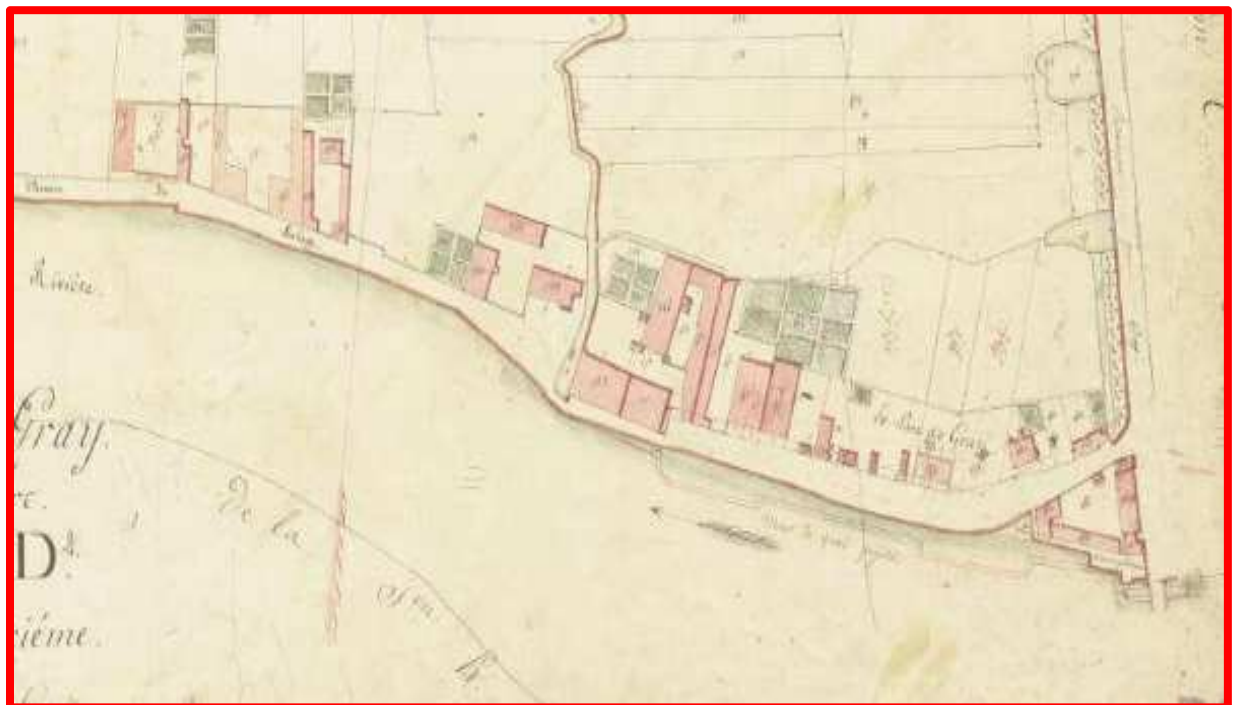
Une partie du territoire de la commune d'Arc et le port de Gray, à droite. Cadastre Napoléonien de 1813.