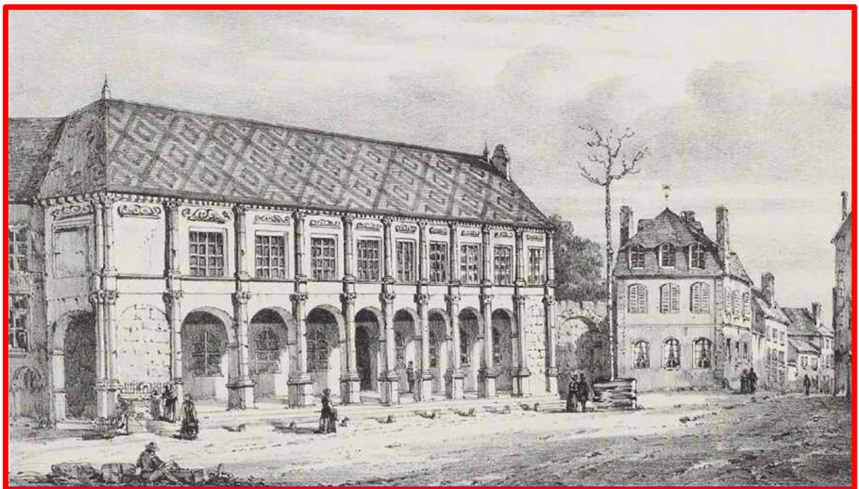
Estampe de l'Hôtel de ville de Gray avant 1850